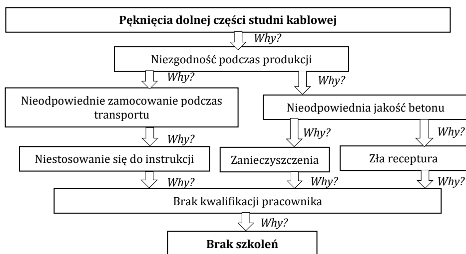
Rys. 3. Metoda 5Why dla problemu pęknięć dolnej części studni kablowej

Priorytetem działań korygujących najczęściej występującej niezgodności powinny być dodatkowe szkolenia pracowników, dotyczące prawidłowego doboru zbrojenia do studni kablowych zgodnych z dokumentacją techniczną oraz zakładania wkładek stabilizująco-dystansujących, okresowego sprawdzania wiedzy o umiejętności pracowników. Dzięki temu pracownicy będą mogli poznać możliwe do wystąpienia usterki i metody zapobiegania powstawania błędów.